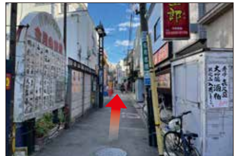
④2つ目の路地を右にまがります。