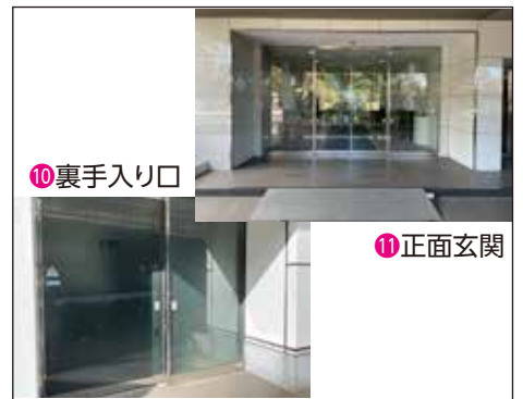
エレベーターで11Fまでお越しく下さい。