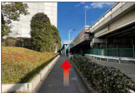
⑨公園内の路地が終わると前に見える白い建物の11Fがテレコムです。