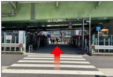
②道に出たら右に曲がると横断歩道があるので渡ります。