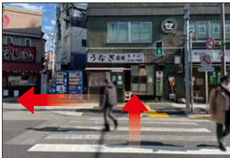
③緑の陸橋をくぐりさらに横断歩道を渡り左に曲がります。