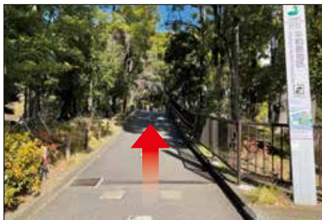
⑧公園内の路地をまっすぐ進みます。