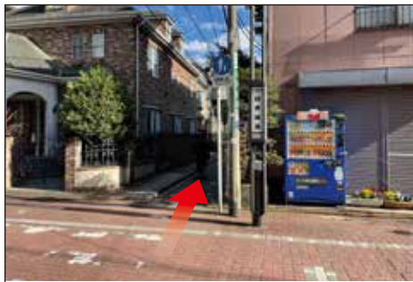
⑤赤い舗装された道を渡り、まっすぐ前にある路地に進みます。