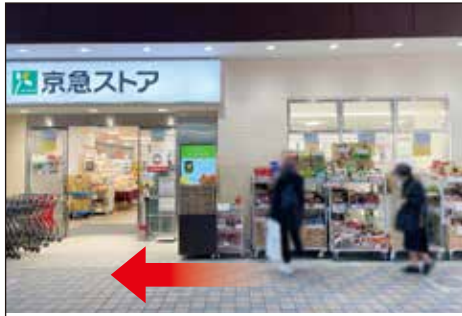
①「平和島駅」改札口を出て左に曲がります。