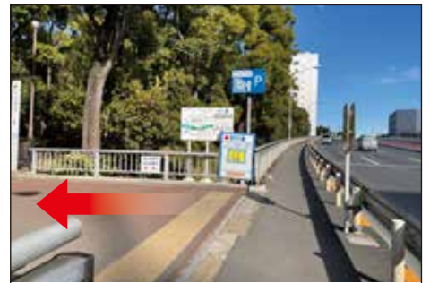
⑦公園に入る路地を左に曲がります。