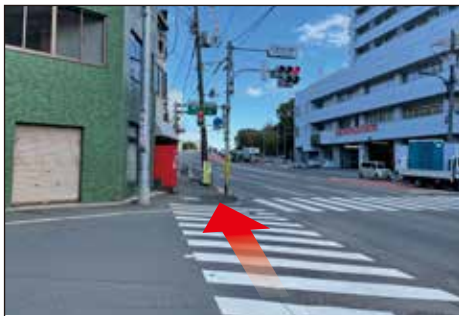
⑥信号のある横断歩道にでるので渡りまっすぐ進みます。